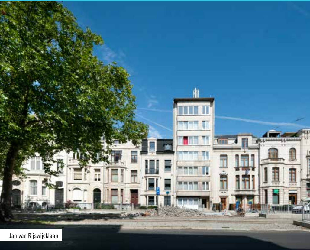
Jan van Rijswijcklaan