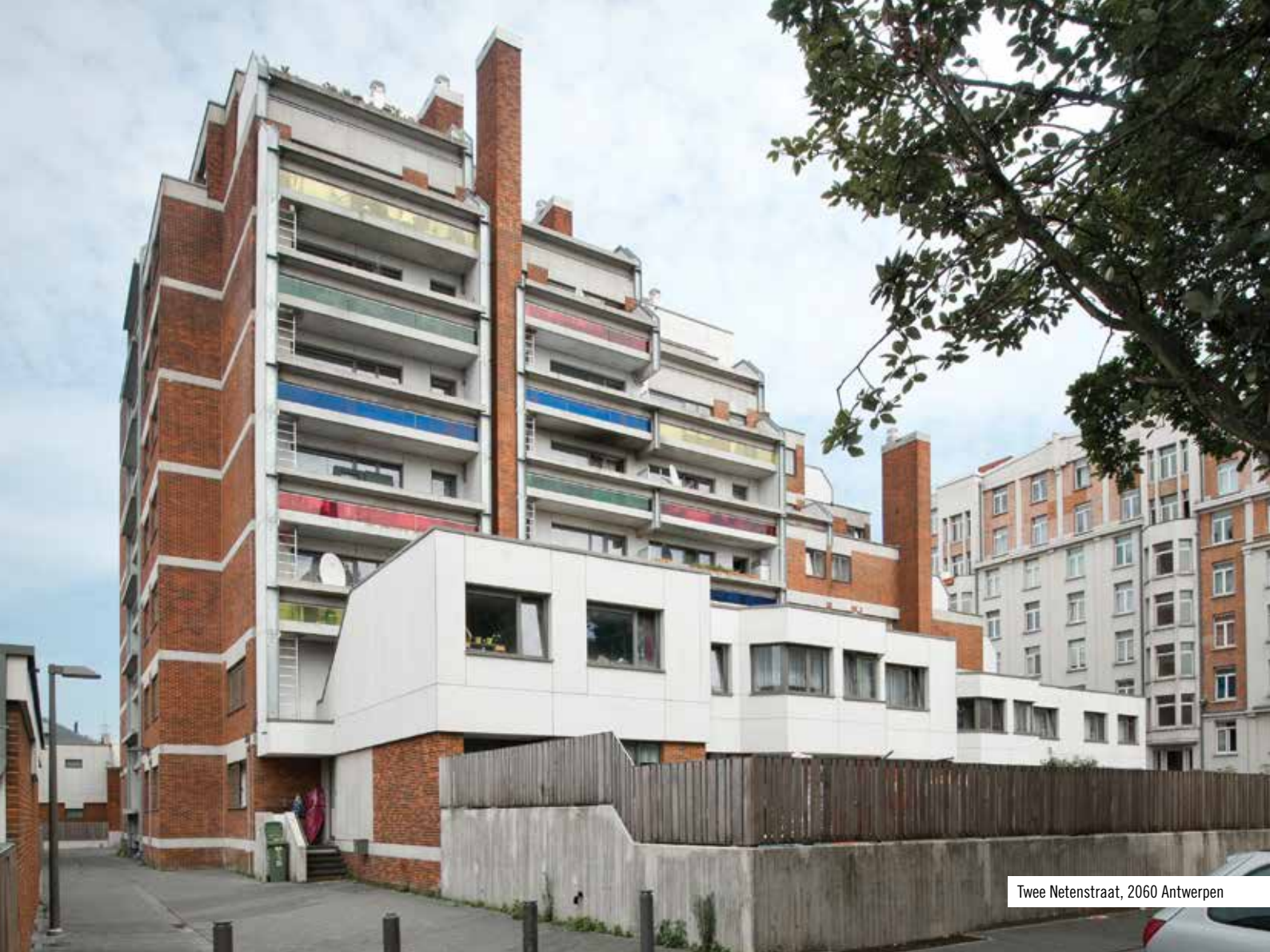
Twee Netenstraat, 2060 Antwerpen